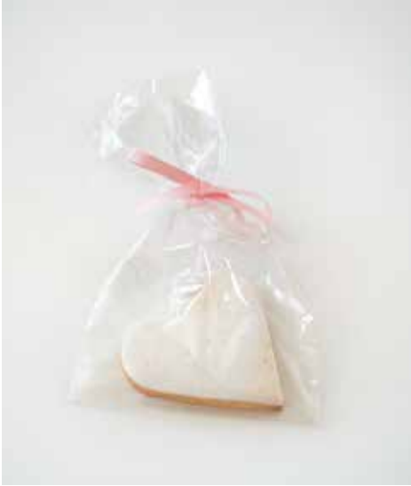
Herz mit Goldspritzer Grösse: 7 x 7 cm