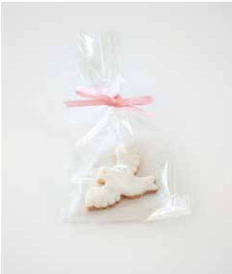
Taube Grösse: 5 x 7 cm