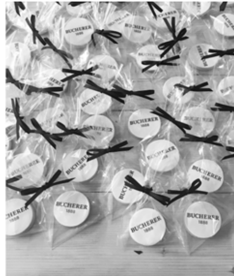
Individuelle Logos Grösse: 6 cm DM

Preis: ab Sfr 6.50 Stück / inkl. Verpackung und Schleife