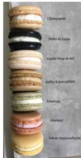
Mindestbestellmenge: 50 Stück pro Sorte / Aroma