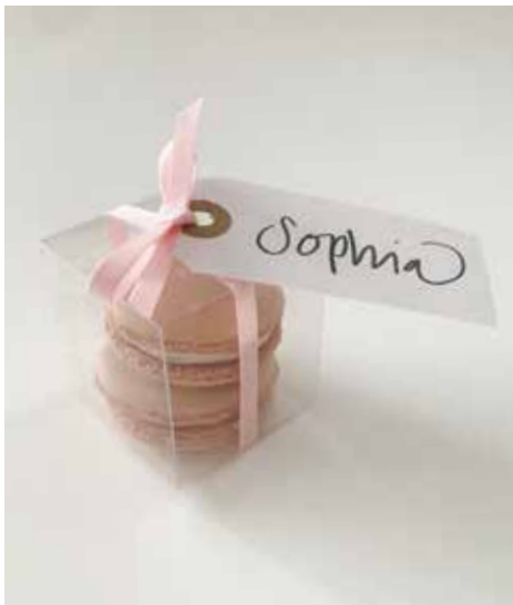
Zwei Macaron im Bööxli mit Schleife und Etikette + Sfr 1.00