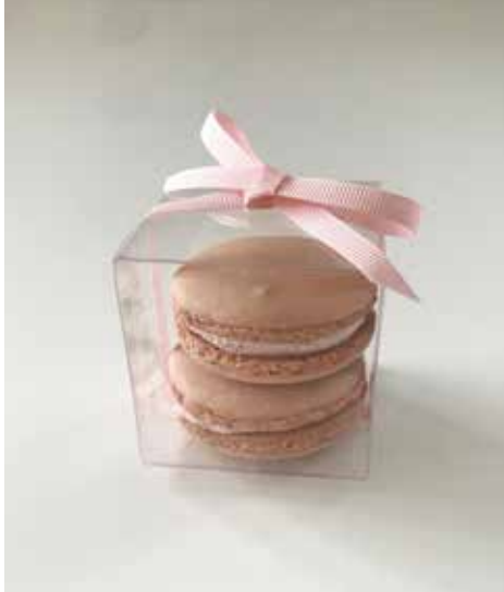
Zwei Macaron im Bööxli mit Schleife (glutenfrei) à Sfr 8.50