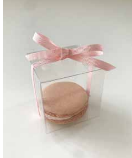
Ein Macaron im Bööxli mit Schleife (glutenfrei) à Sfr 6.50