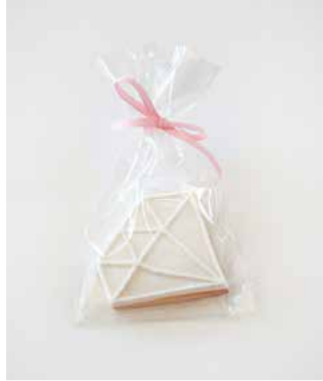
Diamant mit Zuckerrand Grösse: 9 x 8 cm